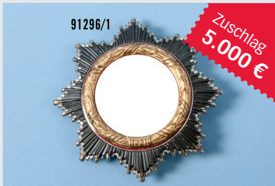
Losnr. 91296 Deutsches Kreuz in Gold