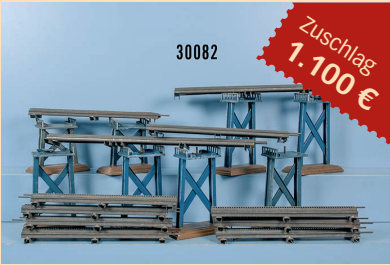
Losnr. 30082 Bing Spur 0 Gleise für Zahnradbahn