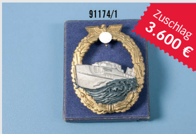
Losnr. 91174 Schnellboot-Kriegsabzeichen