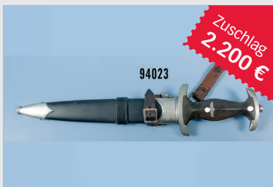
Losnr. 94023 Dienstdolch