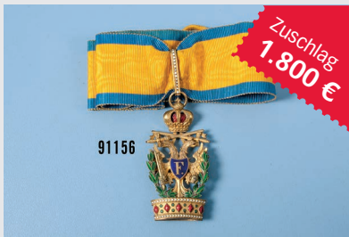
Losnr. 91156 Orden der Eisernen Krone