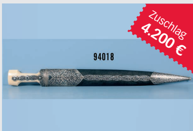
Losnr. 94018 Kindschal