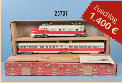
Losnr. 25737 Märklin H0 3017/ST 800 3-teiliger Dieseltriebzug