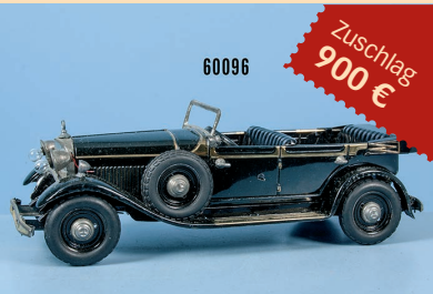
Losnr. 60096 Tipp-Co Wagen des Führers