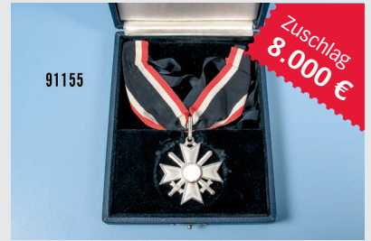
Losnr. 91155 Ritterkreuz zum KVK