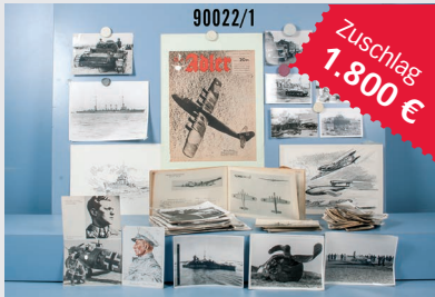
Losnr. 90022 Fotokonvolut 2. WK

Wichtiger Hinweis: Zuschlagpreise ohne Aufgeld