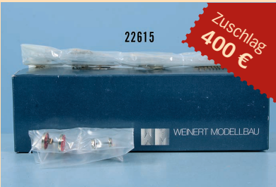
Losnr. 22615 Weinert H0 motorisierter Bausatz für Schleppenderlok