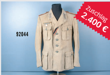
Losnr. 92044 Feldbluse Afrikakorps