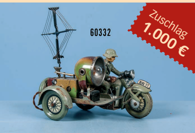
Losnr. 60332 Elastolin Funker auf Motorrad mit Beiwagen