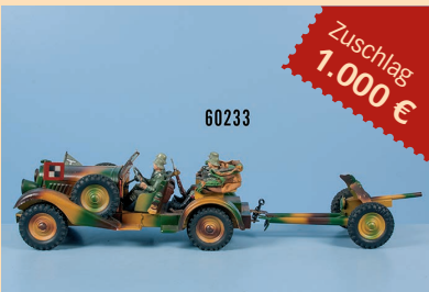
Losnr. 60233 Lineol Kübelwagen WH-6573 mit Pak