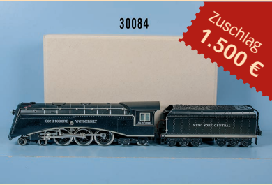
Losnr. 30084 Ritter Replika Spur 0 AK 70/12920 Schleppenderlok