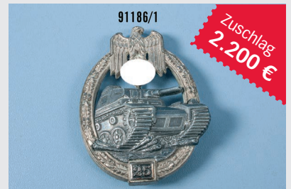
Losnr. 91186 Panzerkampfabzeichen