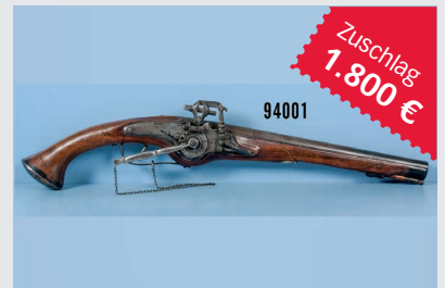
Losnr. 94001 Radtschloßpistole