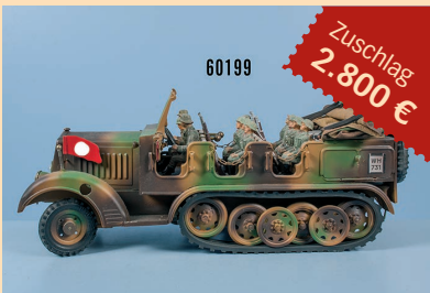
Losnr. 60199 Halbkettenfahrzeug nach Elastolin Vorbild