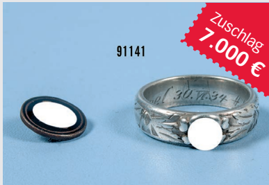
Losnr. 91141 Ehrenring