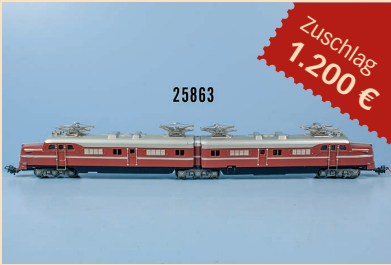
Losnr. 25863 Märklin H0 DL 800 Doppel-E-Lok