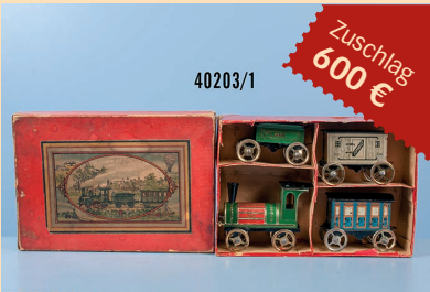
Losnr. 40203/1 Issmayr? Bodenläufer Schleppenderlok mit Wagen