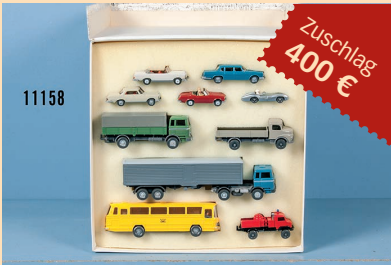
Losnr. 11158 Wiking H0 Werbeset-Packung Mercedes

Wichtiger Hinweis: Zuschlagpreise ohne Aufgeld