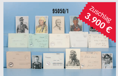
Losnr. 95050 Autographen-Sammlung