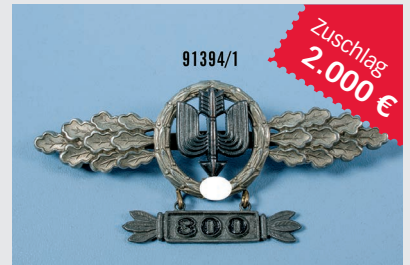
Losnr. 91394 Frontflugsparge