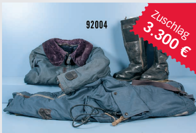
Losnr. 92004 Jagdflyger-Uniform 2. WK