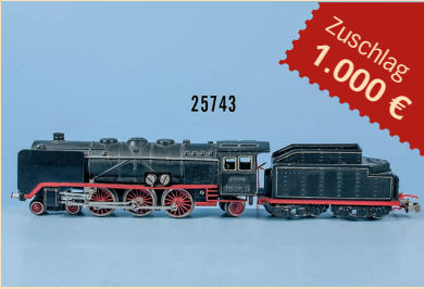
Losnr. 25743 Märklin H0 HR 700 Schleppenderlok