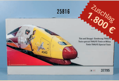
Losnr. 25816 Märklin H0 mfx digital 37795 10-teiliger Elektrotriebzug