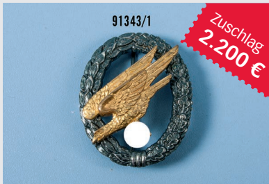
Losnr. 91343 Fallschirmschützenabzeichen