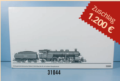
Losnr. 31044 Märklin die neue 1 55005 Schleppenderlok