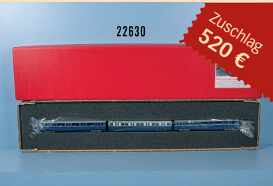
Losnr. 22630 Signalmeister Modellbau H0 S-Bahn Zug