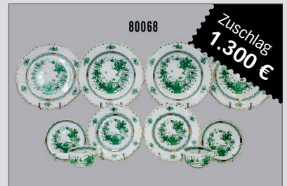
Losnr. 80068 Porzellan Herend, Dekor Apponyi grün