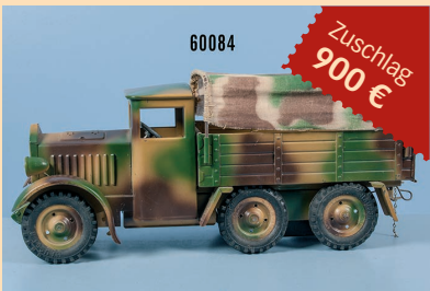
Losnr. 60084 Hausser Elastolin Pritschen Lkw mit Stoffplane