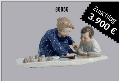
Losnr. 80056 Meissen Porzellan Hentschel Kind