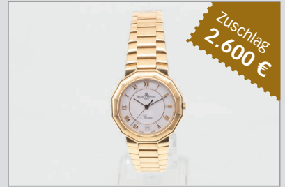
Losnr. 88510 Baume & Mercier, HAU/unisex, Riviera, 18 Karat/750er Gelbgold-Ausführung