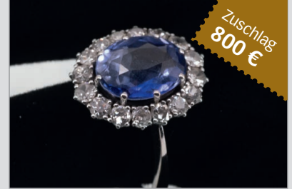
Losnr. 89037 Damenring, 750er Weißgold, mit Saphir und Brillanten