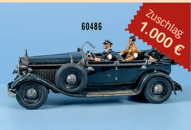
Losnr. 60486 Tipp-Co Wagen des Führers