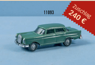
Losnr. 11093 Wiking HO 378/3 A Mercedes 220 Heckflosse