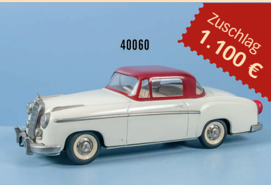
Losnr. 40060 Schuco Rollfix 1085 Mercedes 220 S