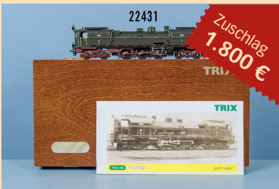
Losnr. 22431 Trix Fine Art 22527/42227 Tenderlok