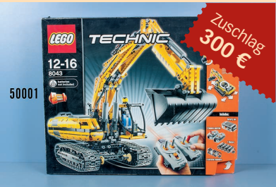
Losnr. 50001 Lego Technic Nr. 8043