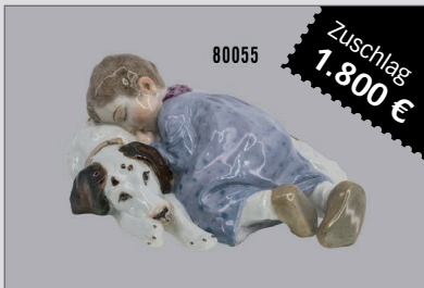
Losnr. 80055 Meissen Porzellan Hentschel Kind