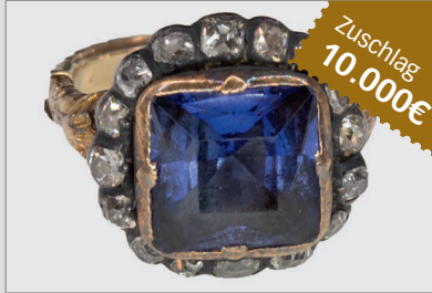
Losnr. 89000 Saphir-Westenknopf, Dresden, aus der Saphirgarnitur Friedrich August des Starken