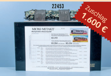
Losnr. 22453 Micro-Metakit Schlepptenderlok der DRB