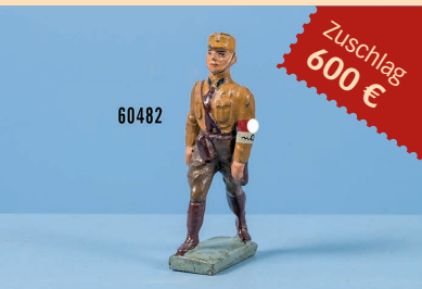
Losnr. 60482 Lineol SA-Hilfspolizist