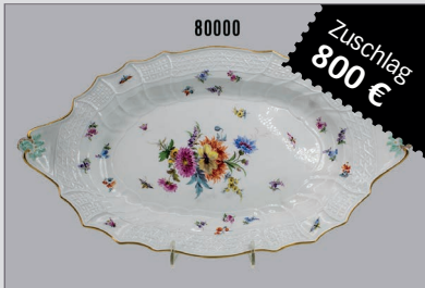
Losnr. 80000 Fleischplatte Meissen aus dem Service für Kaiser Wilhelm II