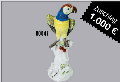
Losnr. 80047 Meissen Porzellan großer Papagai/Ara auf Baumstamm