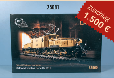
Losnr. 25081 Märklin HO mfx digital 32560 E-Lok Krokodil, teilw. vergoldet