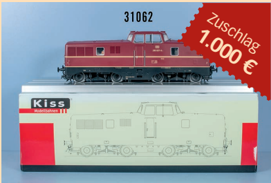
Losnr. 31062 Kiss Spur 1 245153 Diesellok der DB