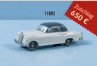
Losnr. 11092 Wiking HO 377/3 I Mercedes 220 Coupe, seltenste Farbvariante