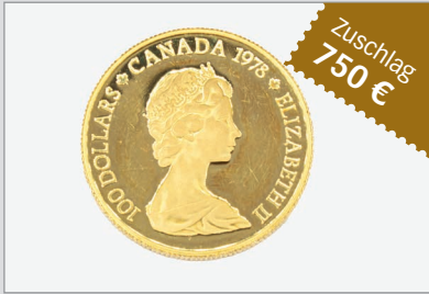
Losnr. 86000 Kanada, 100 Dollar 1978, 917er Gold, 1/2 Unze Feingold