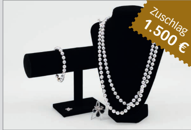
Losnr. 89030 Garnitur Perlenschmuck mit Schließen in Weißgold und Brillanten