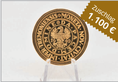
Losnr. 87000 BRD, Medaille 1966, auf die Stadt Dortmund, 900er Gold