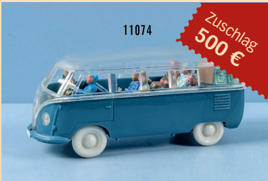
Losnr. 11074 Wiking 1518/2 J VW-Bus Typ 1, 1:40

Wichtiger Hinweis: Zuschlagpreise ohne Aufgeld