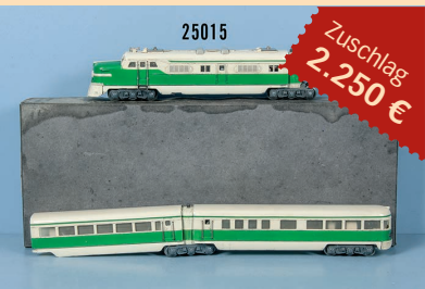
Losnr. 25015 Märklin HO ST 800 Typ 20 Schnelltriebzug