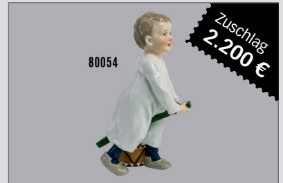
Losnr. 80054 Meissen Porzellan Hentschel Kind