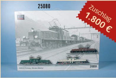
Losnr. 25080 Märklin HO mfx digital Krokodil-Set