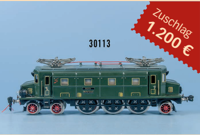
Losnr. 30113 Hehr Spur 0 HS 70/12920 E-Lok