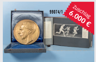
Losnr. 99074 Nachlass Olympia-Teilnehmer