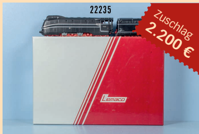
Losnr. 22235 Lemarc H0 088 Stromlinien Schlepp- tenderlok