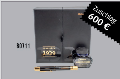
Losnr. 80711 Pelikan Herzstück 1929 Füllfederhalter