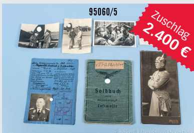
Losnr. 95060 Dokumentennachlass 2. WK