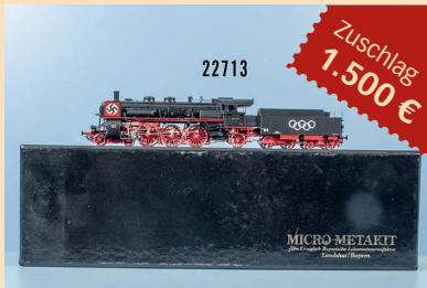
Losnr. 22713 Micro_Metakit H0 94704 Schleppten- derlok