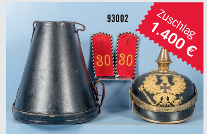
Losnr. 93002 Preußen Pickelhaube