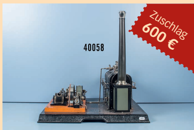
Losnr. 40058 Märklin große liegende Dampfmaschine 4146/9/91