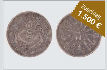
Losnr. 86058 China, Kuang Hsü, 1 Dollar Jahr 24 (1898)