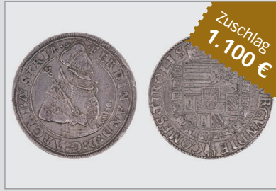
Losnr. 86000 RDR, Erzherzog Ferdinand (1564-1595), dicker doppelter Reichstaler o. J., Hall