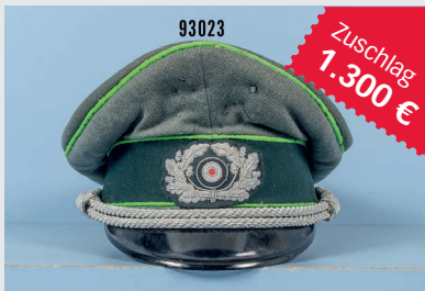
Losnr. 93023 Schirmmütze 2. WK