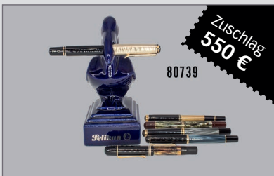
Losnr. 80739 Pelikan 6 Schreibgeräte plus Porzellan Füllfederhalter