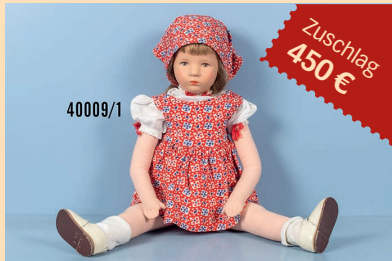
Losnr. 40009 Käthe Kruse Puppenmädchen