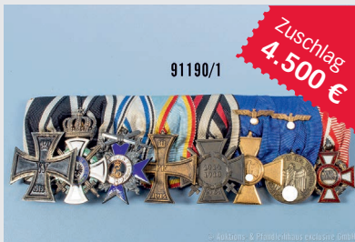
Losnr. 91190 Ordensschnalle GFM Model