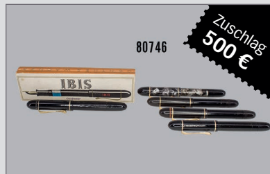
Losnr. 80746 Ibis 4 Füllfederhalter