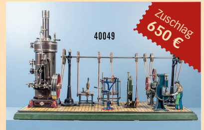
Losnr. 40049 Bing Dampfmaschinenanlage