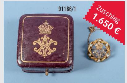
Losnr. 91166 Geschenkbroche Preußen