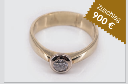
Losnr. 89112 Ring, 585 Gelbgold, mit einem Brillanten ca. 0,4 ct.