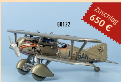
Losnr. 60122 Tipp-Co Militärflugzeug D-IGAN