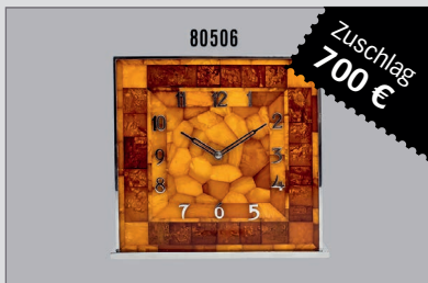
Losnr. 80506 Tischuhr, Bernstein, Art Déco