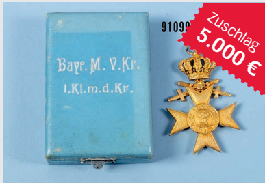
Losnr. 91099 Nachlass Bayern