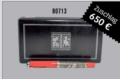
Losnr. 80713 Pelikan Toledo M 710 Füllfederhalter