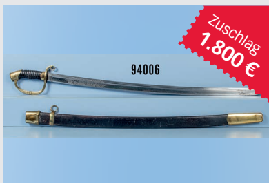
Losnr. 94006 Russland Schaschka