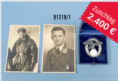
Losnr. 91219 Beobachterabzeichen