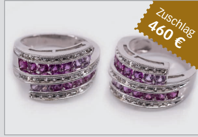
Losnr. 89111 Ring, 585 Weißgold, mit Rubinen und Brillanten