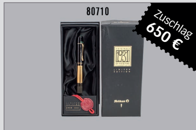
Losnr. 80710 Pelikan 1931 Originals of their Time