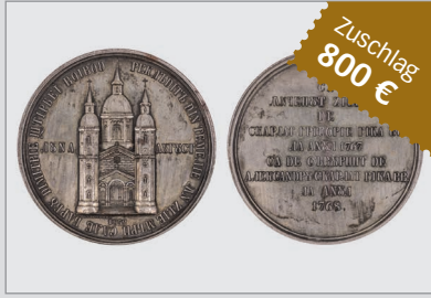
Losnr. 87060 Rumänien, Barbu Dimitrie Stirbei (1799-1869), Medaille 1852