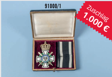
Losnr. 91000 Hausorden von Hohenzollern

Wichtiger Hinweis: Zuschlagpreise ohne Aufgeld