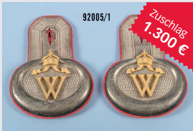
Losnr. 92005 Mecklenburg Epauletten