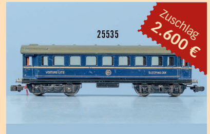
Losnr. 25535 Märklin H0 343 J Typ 1 internationaler Schlafwagen