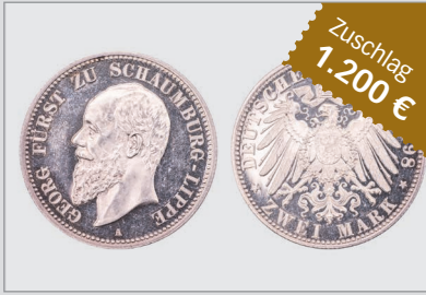
Losnr. 85038 Schaumburg-Lippe, Georg (1893-1911), 2 Mark 1898 A, PP, sehr selten, Auflage in PP nur 162 Stück