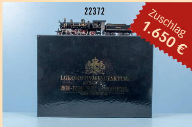
Losnr. 22372 Rauchenecker Feinmechanik H0 98101 Schepptenderlok