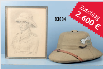
Losnr. 93004 Tropenhelm Kreta