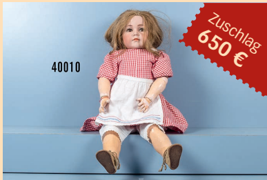
Losnr. 40010 Simon & Halbig Puppenmädchen Nr. 117