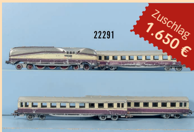
Losnr. 22291 EAW H0 D-Zug, Stromlinien-Tenderlok und 3 Wagen