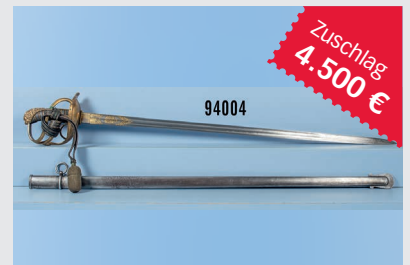
Losnr. 94004 Sachsen Pallasch