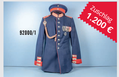
Losnr. 92000 Hessen Uniformrock