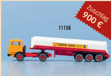
Losnr. 11156 Wiking H0 Werbemodell Transag Suisse