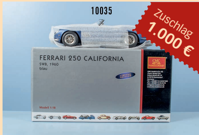
Losnr. 10035 CMC M-092 Ferrari 250 Caifornia SWB

Wichtiger Hinweis: Zuschlagpreise ohne Aufgeld