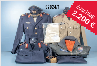
Losnr. 92024 Bw-Uniformnachlass General