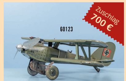
Losnr. 60123 Tipp-Co Doppeldecker D-27