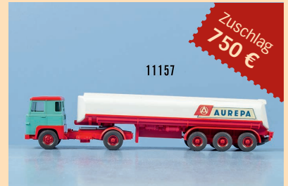
Losnr. 11157 Wiking H0 Werkshandmuster Werbe- modell Aurepa