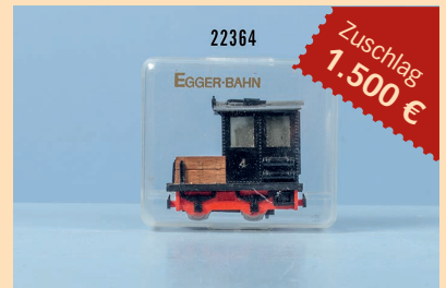
Losnr. 22364 Eggerbahn H0e Feldbahn Prototyp/ Handmuster