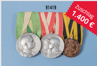
Losnr. 91419 3er Ordensschnalle