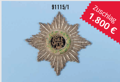
Losnr. 91115 Hessen-Darmstadt Bruststern

Wichtiger Hinweis: Zuschlagpreise ohne Aufgeld