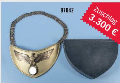
Losnr. 97042 Ringkragen