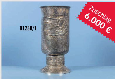
Losnr. 91238 Fliegerpokal