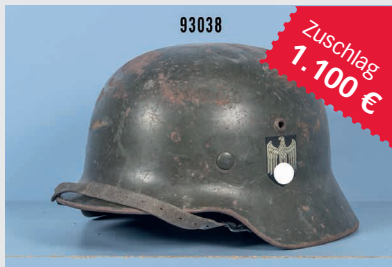
Losnr. 93038 Stahlhelm