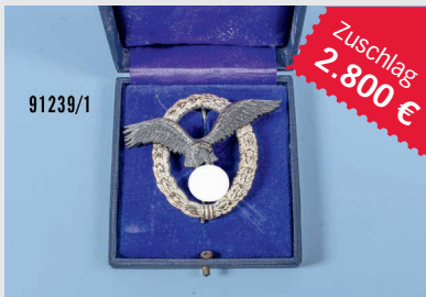
Losnr. 91239 Flugzeugführerabzeichen