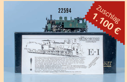
Losnr. 22594 Micro-Metakit/Rauchenecker HO 90010 Tenderlokom