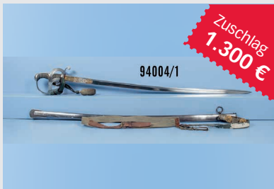
Losnr. 94004 Sachsen Kavalleriesäbel