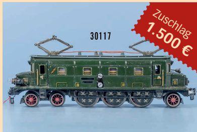
Losnr. 30117 Märklin Spur 0 HS 66/12920 E-Lok