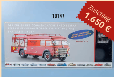
Losnr. 10147 CMC M-084 Ferrari Rennstransporter

Wichtiger Hinweis: Zuschlagpreise ohne Aufgeld