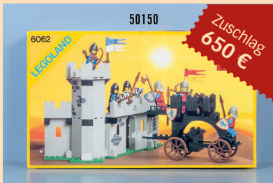
Losnr. 50150 Lego Legoland Ritterburg, OVP