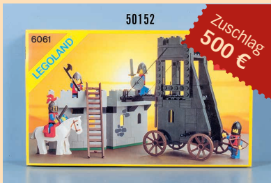
Losnr. 50152 Lego Legoland Löwenritter Belagerungsturm, OVP