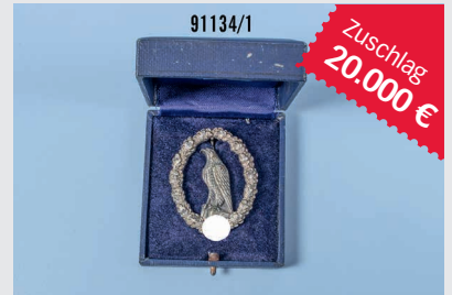
Losnr. 91134 Fliegererinnerungsabzeichen