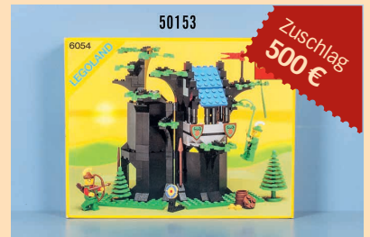
Losnr. 50153 Lego Legoland Förster Versteck, OVP