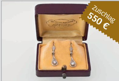
Losnr. 89028 Paar Ohrgehänge, 585 Gelbgold, ca. 1910er/1920er Jahre, platiniiert