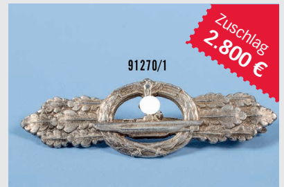
Losnr. 91270 U-Boot-Frontspange