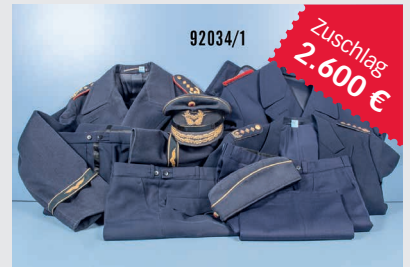
Losnr. 92034 Bundeswehr-Uniformnachlass