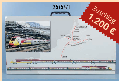
Losnr. 25754 Märklin mfx digital HO 37795 E-Triebzug