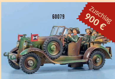
Losnr. 60079 Elastolin Kübelwagen WH 7335

Die Einlieferung eines Einzel- loses bei Spielzeug über 1.000 Euro ist ab sofort provisions- frei.