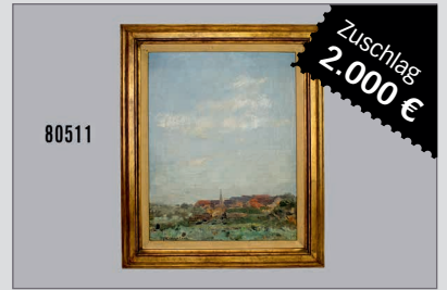
Losnr. 80511 Clarenbach Max, Hamm bei Düsseldorf, Öl auf Leinwand