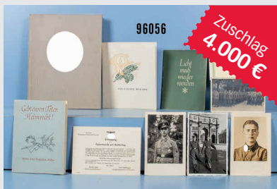
Losnr. 96056 Nachlass 2. WK