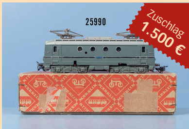
Losnr. 25990 Märklin HO SEWH 800 Typ 3 E-Lok