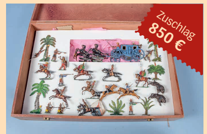
Losnr. 60209 Heyde Buffalo Bill Kutsche