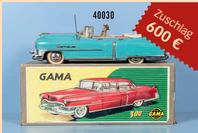
Losnr. 40030 Gama Caillac Cabriolet