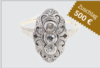
Losnr. 89034 Ring, 14 Karat Gelbgold, um 1910, mit Silberauflage und Diamanten