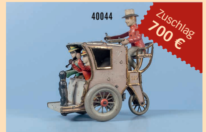
Losnr. 40044 Lemann Kutsche Li-La