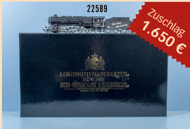
Losnr. 22589 Micro-Metakit/Rauchenecker HO 99102 Schlepptenderlokom