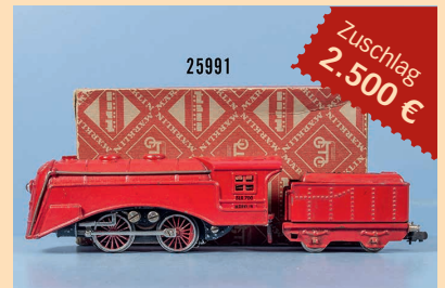
Losnr. 25991 Märklin HO SLR 700 Typ 10 Stromlinien-Schlepptenderlokom