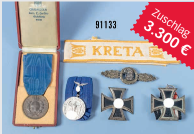
Losnr. 91133 Ordensnachlass 2. WK