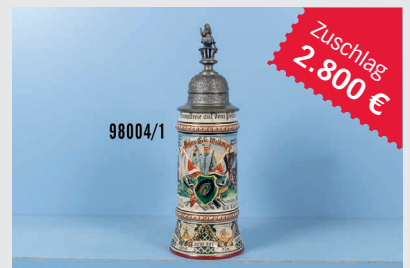
Losnr. 98004 Preußen Reservistenkrug