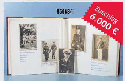
Losnr. 95068 Foto- und Urkundennachlass