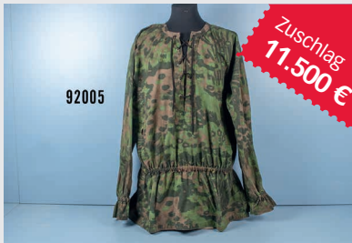
Losnr. 92005 Schlupfjacke 2. WK