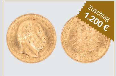
Losnr. 86017 Preußen 10 Mark Goldmünze