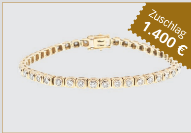
Losnr. 82004 Tennisarmband, 750er Gelbgold mit Brillanten