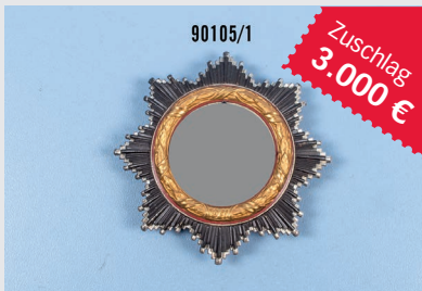
Losnr. 90105 Deutsches Kreuz in Gold