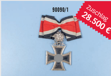
Losnr. 90090 Ritterkreuz mit Eichenlaub und Schwertern