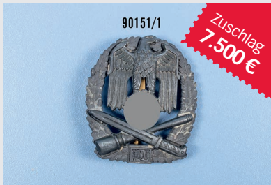
Losnr. 90151 Allgemeines Sturmabzeichen „100“