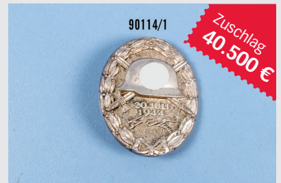
Losnr. 90114 Verwundetenabzeichen 20. Juli 1944