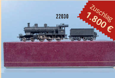
Losnr. 22030 Fulgurex HO Schlepptenderlok der SBB