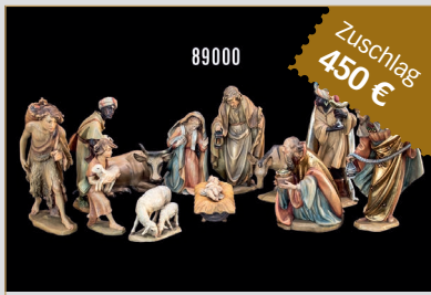
Losnr. 89000 Anri / Bernadi Ulrich Krippenfiguren