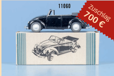
Losnr. 11060 Wiking VW Käfer Cabrio Typ 1, 1505/3H

Wichtiger Hinweis: Zuschlagpreise ohne Aufgeld