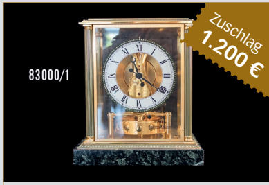
Losnr. 83000 Jaeger-LeCoultre Atmos Uhr