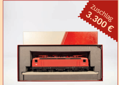
Losnr. 31123 Lemaro Spur 1 E-Lok der DB 1-009/4 3.300 € (3.300 € für den Einlieferer)