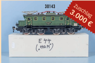
Losnr. 30143 HGM Spur 0 E-Lok; Zuschlag 3.000 € und Auszahlung an Einlieferer 3.000 €