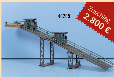
Losnr. 40205 Brückenaufgang mit 2 Beförderungswagen, VK