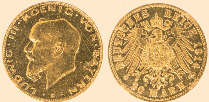
Abb. Goldmünze Kaiserreich 20 Mark Bayern Ludwig III 1914 D, Erhaltung ss - vz, 7,933 g, Feingehalt 900, ehemals als Ketten- anhänger gefasst (Randspuren), zeitgenössische Originalprägung fraglich, es könnte sich auch um eine sog. Schmidt/Hausmann Nachprägung handeln, bitte besichtigen (Losnr. 86003)

Wir bieten günstige Einlieferungskonditionen, hohe Fachkompetenz, diskrete und schnelle Abwicklung.