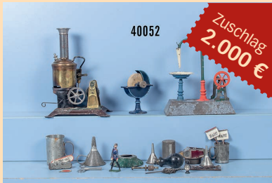
Losnr. 40052 Diverses Dampfmaschinenzubehör