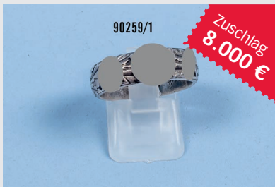
Losnr. 90259 Ehrenring