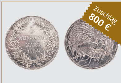
Losnr. 87007 5 Mark Neu-Guinea Pradiesvogel Silbermünze