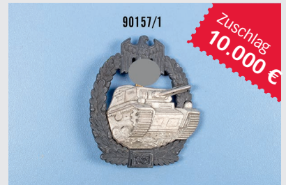
Losnr. 90157 Panzerkampfabzeichen „75“