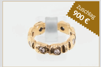
Losnr. 82016 Ring 585er Gelbgold mit Brillanten