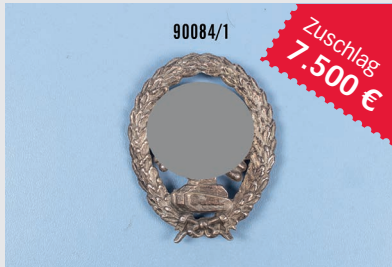
Losnr. 90084 Panzertruppenabzeichen Legion Condor

Wichtiger Hinweis: Zuschlagpreise ohne Aufgeld