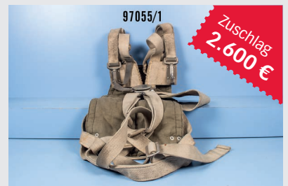
Losnr. 97055 Fallschirmgurtzeug