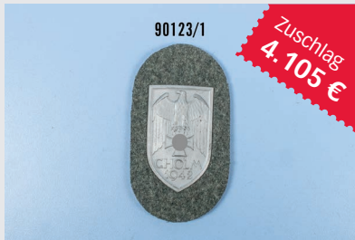
Losnr. 90123 Cholmschild