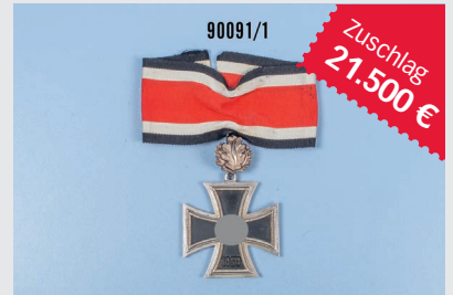
Losnr. 90091 Ritterkreuz mit Eichenlaub