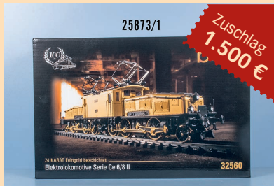
Losnr. 25873 Märklin mfx digital H0 32560 E-Lok Krokodil