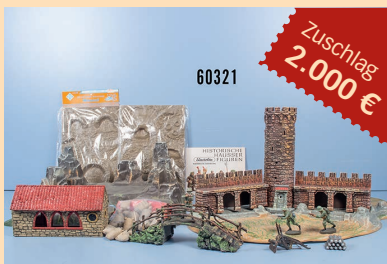
Losnr. 60321 Elastolin kleine Berglandschaft