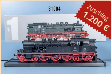
Losnr. 31004 Märklin Spur 1 Profi mfx digital Tenderlok 55077