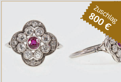
Losnr. 82129 Ring Platin mit Entourage von 8 Diamanten