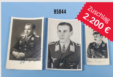
Losnr. 95044 3 Fotos mit Ritterkreuzträgern