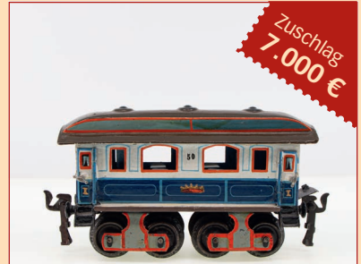
Losnr. 30128 Spur 0 Speisewagen des Kaiserzugs 7.000 € (7.000 € für den Einlieferer)