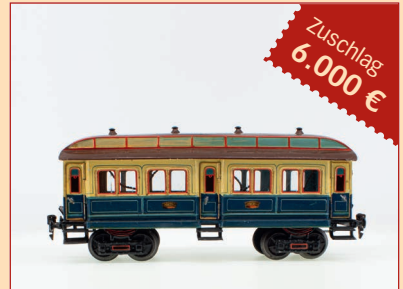
Losnr. 31101 Märklin Spur 1 1847K Salonwagen des kaiserlichen Hofzuges 6.000 € (6.000 € für den Einlieferer)