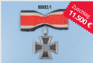
Losnr. 90092 Ritterkreuz des Eisernen Kreuzes