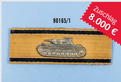
Losnr. 90165 Panzervernichtungsabzeichen