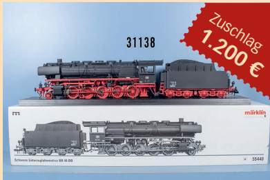
Losnr. 31138 Märklin Profi Spur 1 Schlepptenderlok 55440