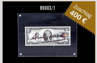
Losnr. 89003 Warhol Andy, Zwei-Dollar-Geldschein mit Signatur