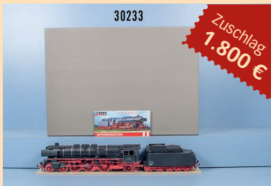
Losnr. 30233 Kiss Spur 0 Schlepptenderlok 400001