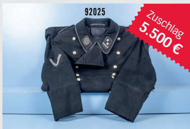
Losnr. 92025 Mantel eines Hauptscharführers