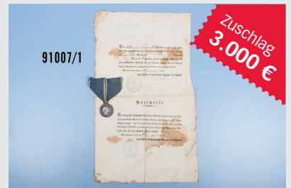
Losnr. 91007 Waterloo-Medaille mit Urkunde