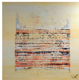
Los.Nr. 81054 Bild mit Acryl bemalt 140 x 140 cm