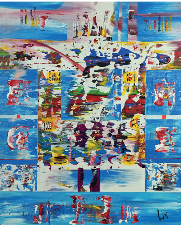
Los.Nr. 81056 Bild mit Acryl bemalt 80 x 100 cm

www.lot-tissimo.com/de-de/auction-catalogues/exclusive/catalogue-id-exclus10076