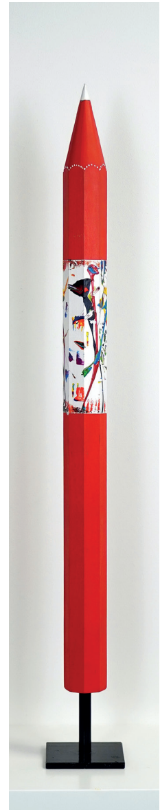
Los.Nr. 81090 Skulptur, Bleistift aus Holz mit Acryl bemalt Höhe 78 cm

Willkommen zu einer außergewöhnlichen Sonderauktion des renommierten Künstlers Manfred Weig aus Kehl. Diese Auktion bietet eine einmalige Gelegenheit, Werke direkt aus dem persönlichen Bestand des Künstlers zu erwerben. Es handelt sich um seine eigenen, finalen Stücke – nicht um Werke aus Vorbesitz, sondern um originale Arbeiten, die bis zuletzt in seinem Besitz waren.