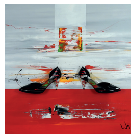
Los.Nr. 81009 Bild mit Acryl bemalt 80 x 80 cm